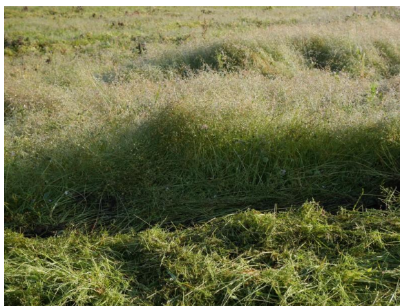
Blomstrende tunrapp i rappgjenlegget

Noen ganger kan det være tvil om et gjenlegg tilfredsstillende kravene til å kunne godkjennes, antall planter/kvm er vesentlig. Sjøl om en ikke har et ideelt planteantall kan tynne bestander være tilfredsstillende. For de fleste artene er et antall på 100 pl/kvm ønsket, men det halve og noen ganger mindre er det også kan være godt nok. Særlig for arter som tettes igjen ved stengelutløpere vil ei tynn eng det første året få optimal tetthet det neste foråret. Vi har sett at det noen ganger kan være en diskusjon om et gjenlegg kan godkjennes eller ikke, det som er vesentlig er at det finnes planter der, dessuten at det ikke er for mye problematisk ugras. Når det gjelder ugras så vil mye av det være borte neste år, det gjelder også tunrapp som har blomstret, den dør bort i løpet av vinteren. Et gjenlegg kan derfor være ganske rufsete i gjenleggsåret men likevel være tilfredsstillende. Ugras som er problematiske er for eksempel veldig mye kveke i arter hvor kveke er et problem, f.eks. i bladfaks.